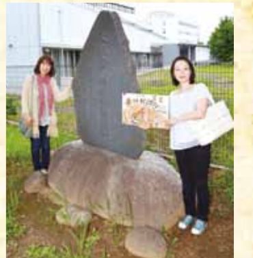
記念碑は南荻島五社稲荷神社の参道に面して立つ。木々に囲まれ、やさしい風が吹き抜けるこの場所は当時の雰囲気そのままだと残っている。

とにかく自由で、何かをやらされたという記憶がありません。自分たちで考え、それを「やった」という達成感を味わっていましたが、そのように指導して下さっていたんですね。そして、遊びを通して生きる力をつける。そうした考え方が行き渡っていた幼稚園でした。お弁当の作り方や日常生活での注意点など、先生による育児指導もあったと母から聞いています。今あったら、自分の子どもを入れたい!すごい幼稚園でした。