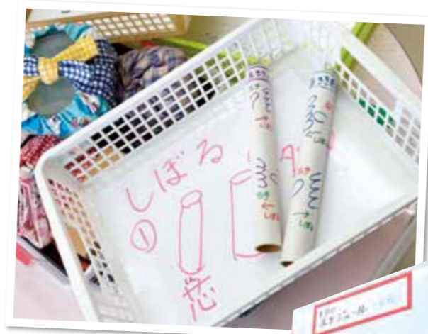
お手製の教材で雑巾絞りやリボン結びなどの正しいやり方を指導。