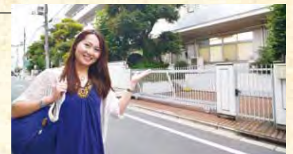
正門と校舎は今も現役で付属中高の施設として使用されている。