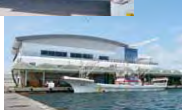
新設の魚市場には2~3時間に一般、水揚げ船が帰港する。