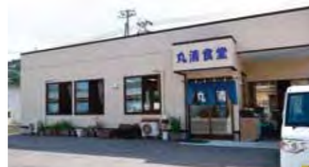
震災後2011年10月に再開した丸清食堂。

キャンパスは旗の台にあり、雪谷大塚にあったアパートに、同じく文教に通う姉と一緒に住んでいました。テニス同好会の夏合宿で軽井沢に行ったり、文化祭の企画で歌手の松崎しげるさんと呼んだけれんのだを覚えています。同級生とは、結婚式で会って以降は年賀状のやりとりだけだったのですが、被災したのを知ると連絡をくれました。「必要なものない？」と物資を送ってくれ、夏にはお見舞いにも来てくれました。嬉しかったですね。