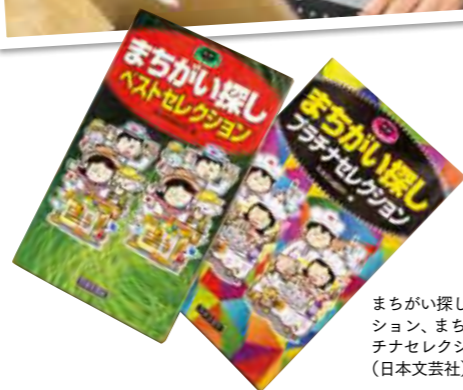
まちがい探しベストセクション、まちがい探しプラチナセクション (日本文芸社)