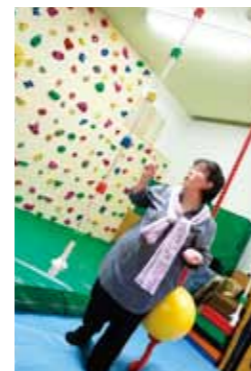
子どもにもひと目で1日の予定が理解できるように工夫している。